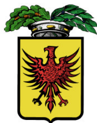
Provincia di Ravenna